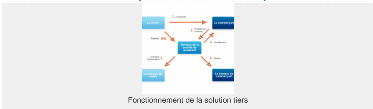
Fonctionnement de la solution tiers

Ces solutions sont des passerelles de paiement sécurisé qui permettent de faire le lien entre les acheteurs de votre boutique en ligne et les banques. Elle fournissent un service d'assurance complémentaire à celles proposées par la banque