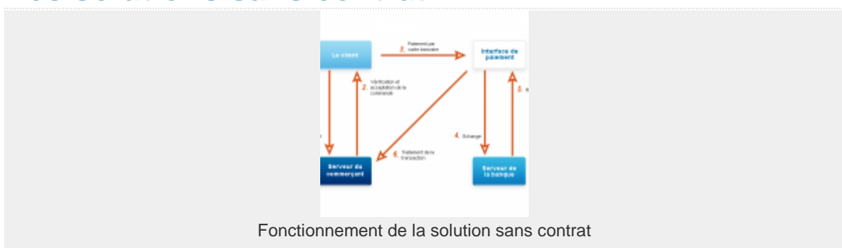
Fonctionnement de la solution sans contrat

Ici, vous pourrez souscrire à un système de paiement en ligne qui vous permettra d'accepter les paiements par carte bancaire et de recevoir à date